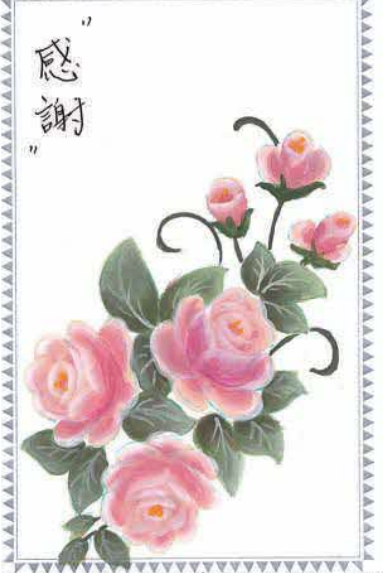
西ノ島町食生活改善推進協議会 Y.M

昨日、義兄が亡くなりました。 家族がみられる。施設の方に お世話になっての最後でした。 葬儀も子供、兄弟も参加出来 ず(都合のため)淋しいもの でした。 がまん、がまんの生活です。 いままで続くのか？ 施設・保健所、福祉団体・医療 などでの仕事をしておられる方々 には、本当に本当に感謝 しております。 体に気をつけて、無理なほど！ テレビ等では「オリンピック」 よその国の話のように思えます。 ます、人命を！